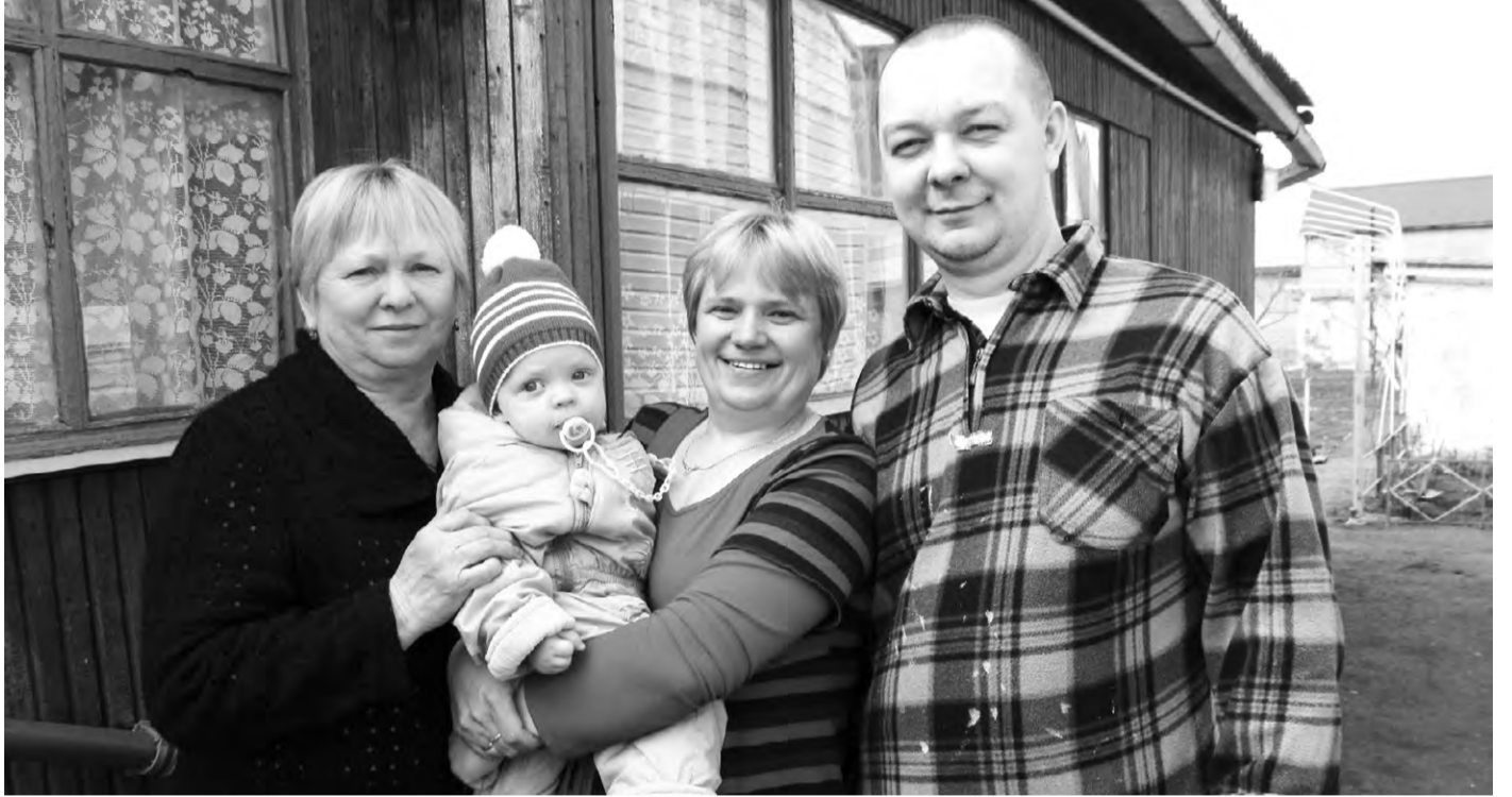
Дом семьи Тарасовых надежно защищен

АО «Орёлблэнерго» устанавливает системы пожарной сигнализации в домах 20 многодетных социально незащищенных семей.