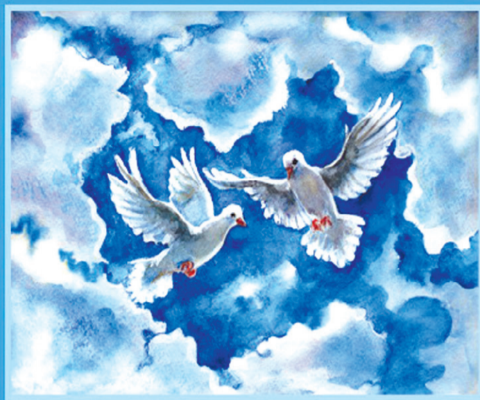
сборник современной орловской поэзии