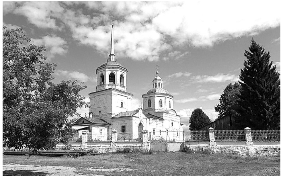
Церковь Похвалы Богородицы

В конце 1582 года против 10-тысячной армии Кучума выступил отряд Ермака в 540 человек и 300 ратных людей из владений Строгановых. Кучум потерпел абсолютное поражение, Ермак вступил в покинутую татарами столицу Сибири Кашлык.