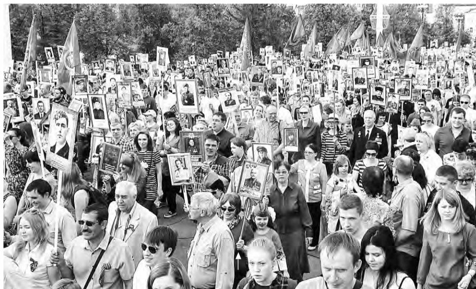
г. Орел. 9 Мая 2016 года. Шествие «Бессмертного полка»