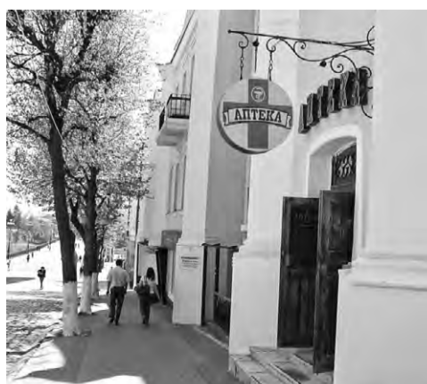
ФОТО СДЕЛАНО 2 МАЯ 2017 ГОДА