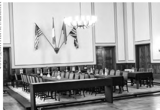
Зал, где был подписан акт о капитуляции Германии