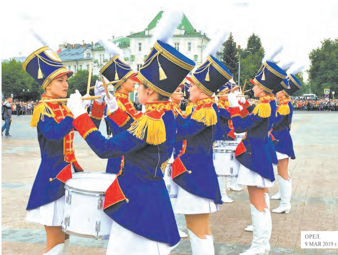
ОРЛ. 9 МАЯ 2019 г.

нях разных статей и комплекций — от 42 до 48 размеров.