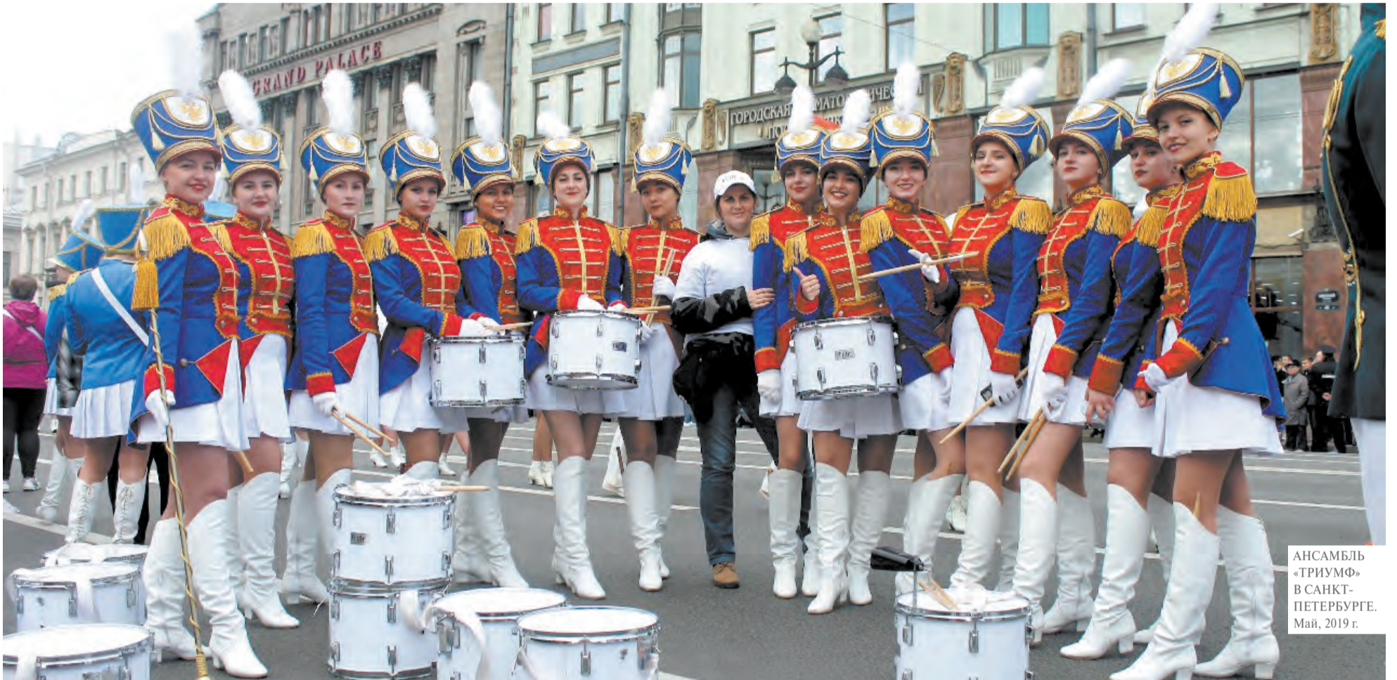
АНСАМБЛЬ «ТРИУМФ» В САНКТ- ПЕТЕРБУРГЕ. Май, 2019 г.

как инструмент... женской привлекательности