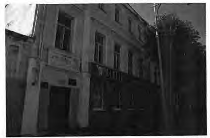
21.06.2016 Дата съемки (число, месяц, год)

Фотографическое изображение объекта культурного наследия, за исключением отдельных объектов археологического наследия, фотографическое изображение которых вносится на основании решения соответствующего органа охраны объектов культурного наследия