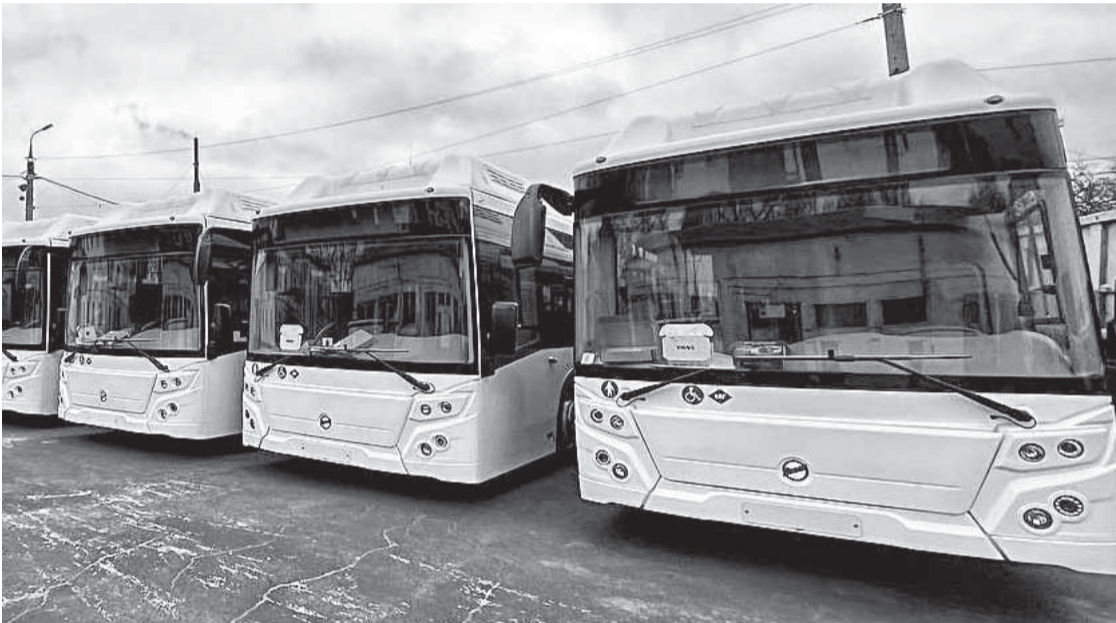
НОВЫЕ АВТОБУСЫ. ФОТО ПРЕСС-СЛУЖБЫ АДМИНИСТРАЦИИ ОРЛА

В минувшую пятницу мэр Орла Юрий Парахин обсудил с перевозчиками наболевшие проблемы транспортного обслуживания горожан, сообщили в пресс-службе городской администрации.