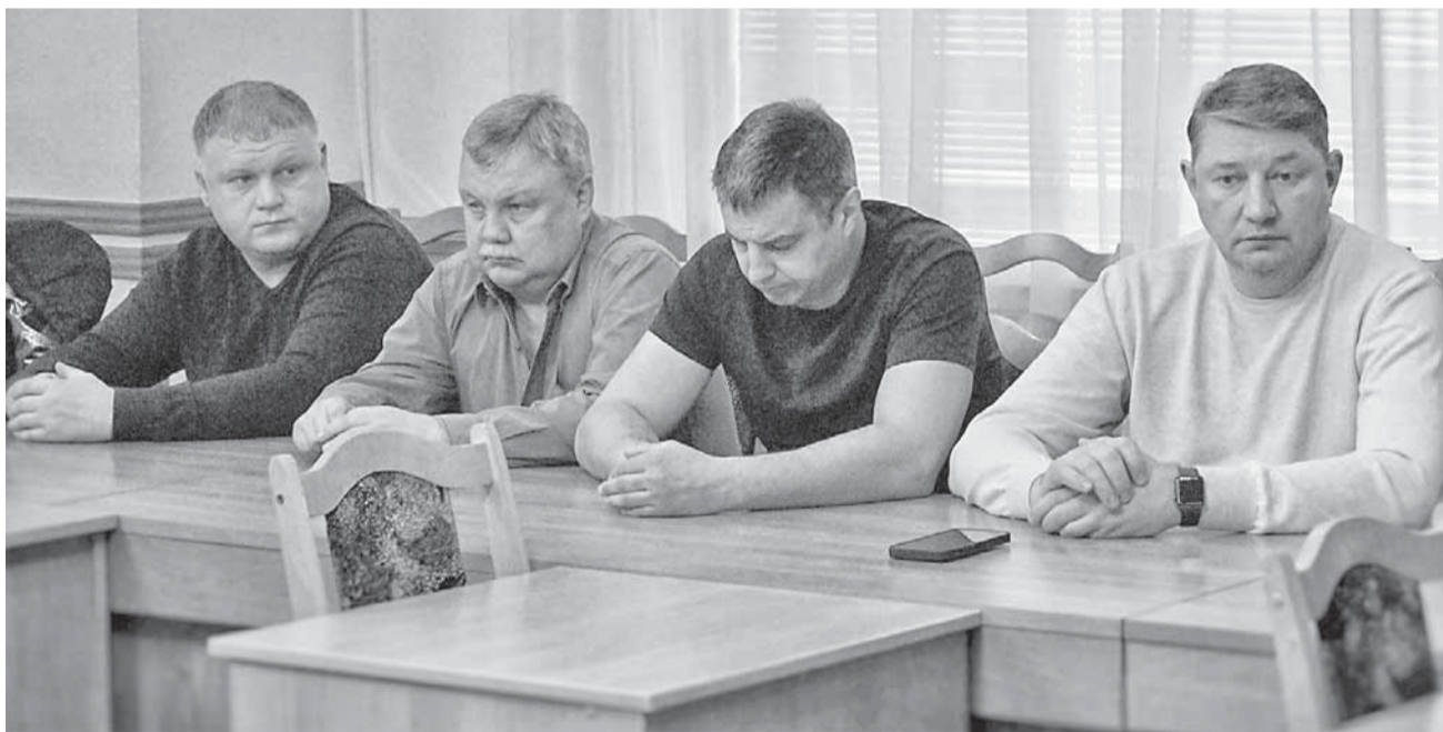
НА ВСТРЕЧЕ С ПЕРЕВОЗЧИКАМИ.

Он подчеркнул, что администрация Орла обязательства выполняет. Так, компенсация из городского бюджета за перевозку льготных категорий граждан будет полностью закрыта до конца года. А вот со стороны перевозчиков нет понимания. Например, переполненность транспорта в часы пик свидетельствует о том, что не соблюдаются графики движения. Речь идет и о частниках, и о МУП «Трамвайно-троллейбусное предприятие».