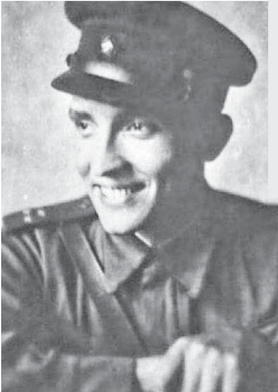
НАЧАЛЬНИК ГЛАЗНОЙ ГРУППЫ УСИЛЕНИЯ ОРМУ НА ЧИТИНСКОМ НАПРАВЛЕНИИ ЗАБАЙКАЛЬСКОГО ФРОНТА. 1945Г.