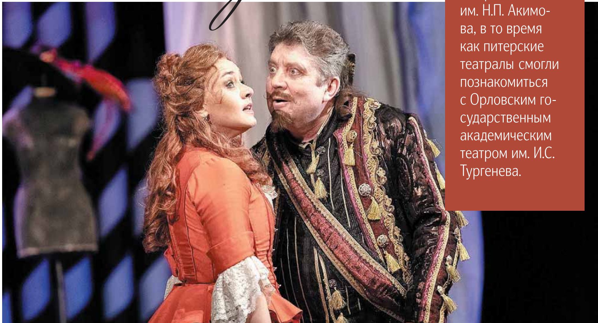
САНКТ-ПЕТЕРБУРГСКИЙ ТЕАТР КОМЕДИИ. СПЕКТАКЛЬ «ХИТРАЯ ВДОВА»

В Орле побывал с гастролями Санкт-Петербургский государственный академический театр комедии им. Н.П. Акимова, в то время как питерские театралы смогли познакомиться с Орловским государственным академическим театром им. И.С. Тургенева.