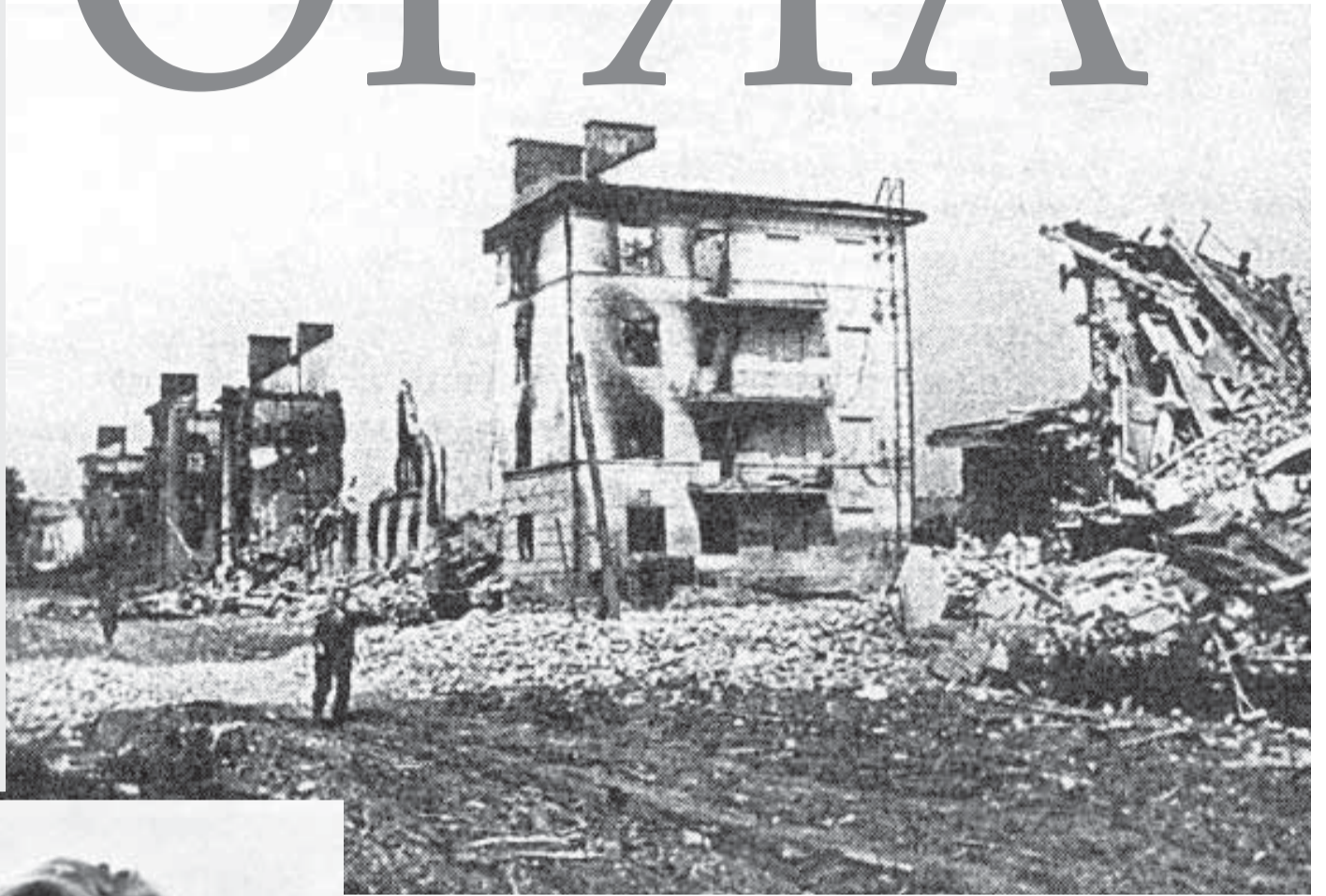
ВИД РАЗРУШЕННОЙ УЛ. МОСКОВСКОЙ, 1943 г.

Как выглядел город после освобождения от фашистской оккупации и как шло его восстановление и строительство – об этом рассказал в своих воспоминаниях главный архитектор Орла Борис Антипов. При его непосредственном участии сложился тот облик города, который мы знаем сегодня.