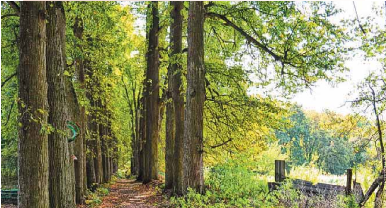
ФОТО ДЕНИС КИРИЛЮК «ЭКСКУРСИИ ПО ОРЛУ»

29-30 июля в Орловском муниципальном округе состоится литературно-музыкальный фестиваль «Летопись» (0+).