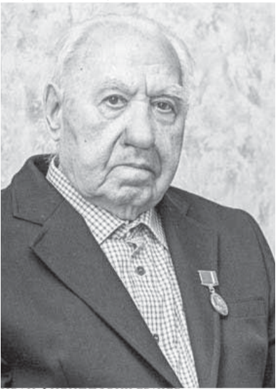
ИВАН ФИЛИППОВИЧ ГРАЧЕВ