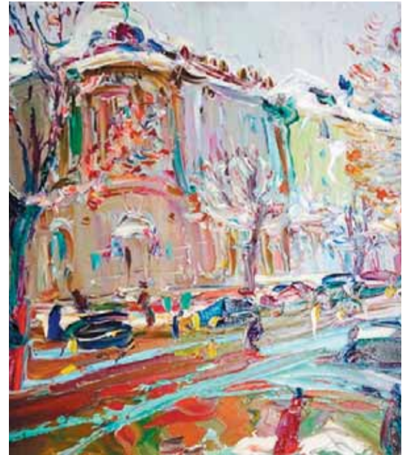
КАРТИНА ОЛЬГИ ДУШЕЧКИНОЙ «ОРЕЛ. ФЕВРАЛЬ».

4 августа, накануне Дня города Орла, в Орловском музее изобразительных искусств откроется выставка «Город Орел в произведениях художников XX-XXI веков» (6+).