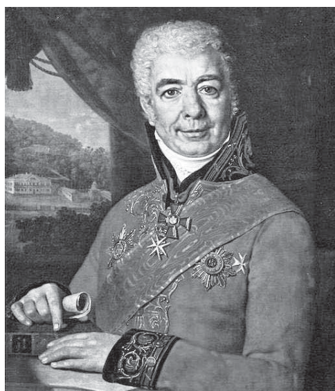
З.Я. КАРНЕЕВ. 1810 Г. ХУД. В.Л. БОРОВИКОВСКИЙ. ГОСУДАРСТВЕННЫЙ ИСТОРИЧЕСКИЙ МУЗЕЙ.