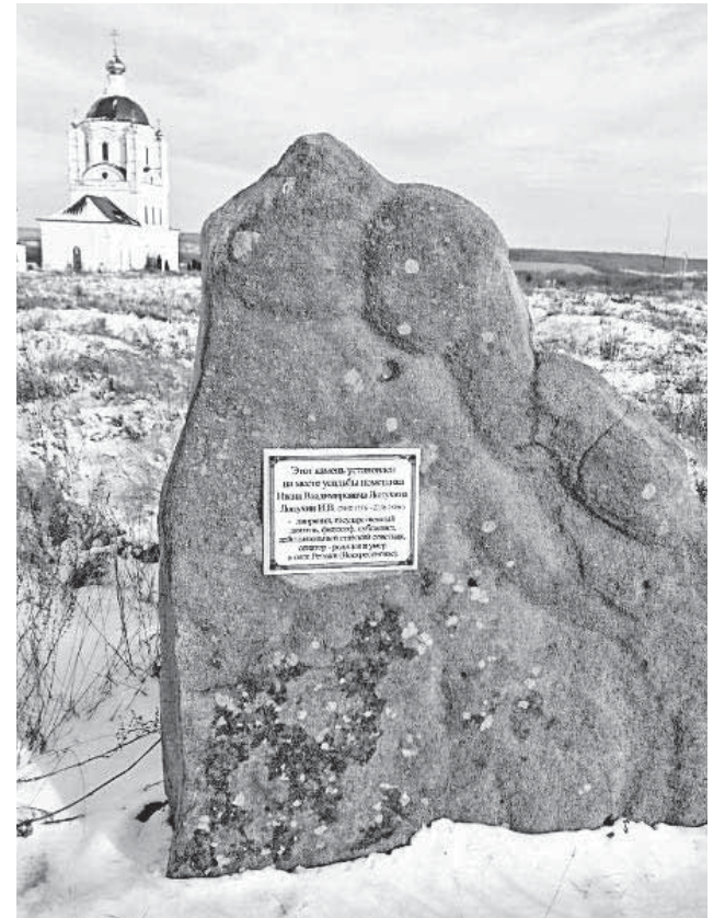
КАМЕНЬ, УСТАНОВЛЕННЫЙ НА МЕСТЕ УСАДЬБЫ И.В. ЛОПУХИНА (1756–1816) В СЕЛЕ РЕТЯЖИ КРОМСКОГО Р-НА ОРЛОВСКОЙ ОБЛ. 2023 Г.

Послушать молодого ученого в Орле пришло большое количество орловцев, среди них были и краеведы, которые владели информацией