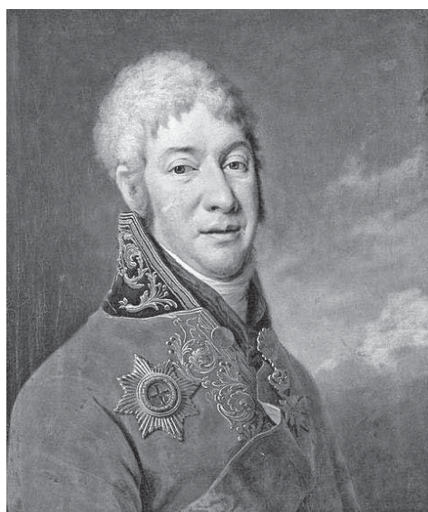
И.В. ЛОПУХИН. 1802 Г. ХУД. Д.Г. ЛЕВИЦКИЙ. ТРЕТЬЯКОВСКАЯ ГАЛЕРЕЯ.

году, М.К. Соколовский создал «Общество ревнителей истории». Кстати сказать, он занимался изучением истории 17-го гусарского Черниговского полка, квартировавшего в Орле до 1914 года. В