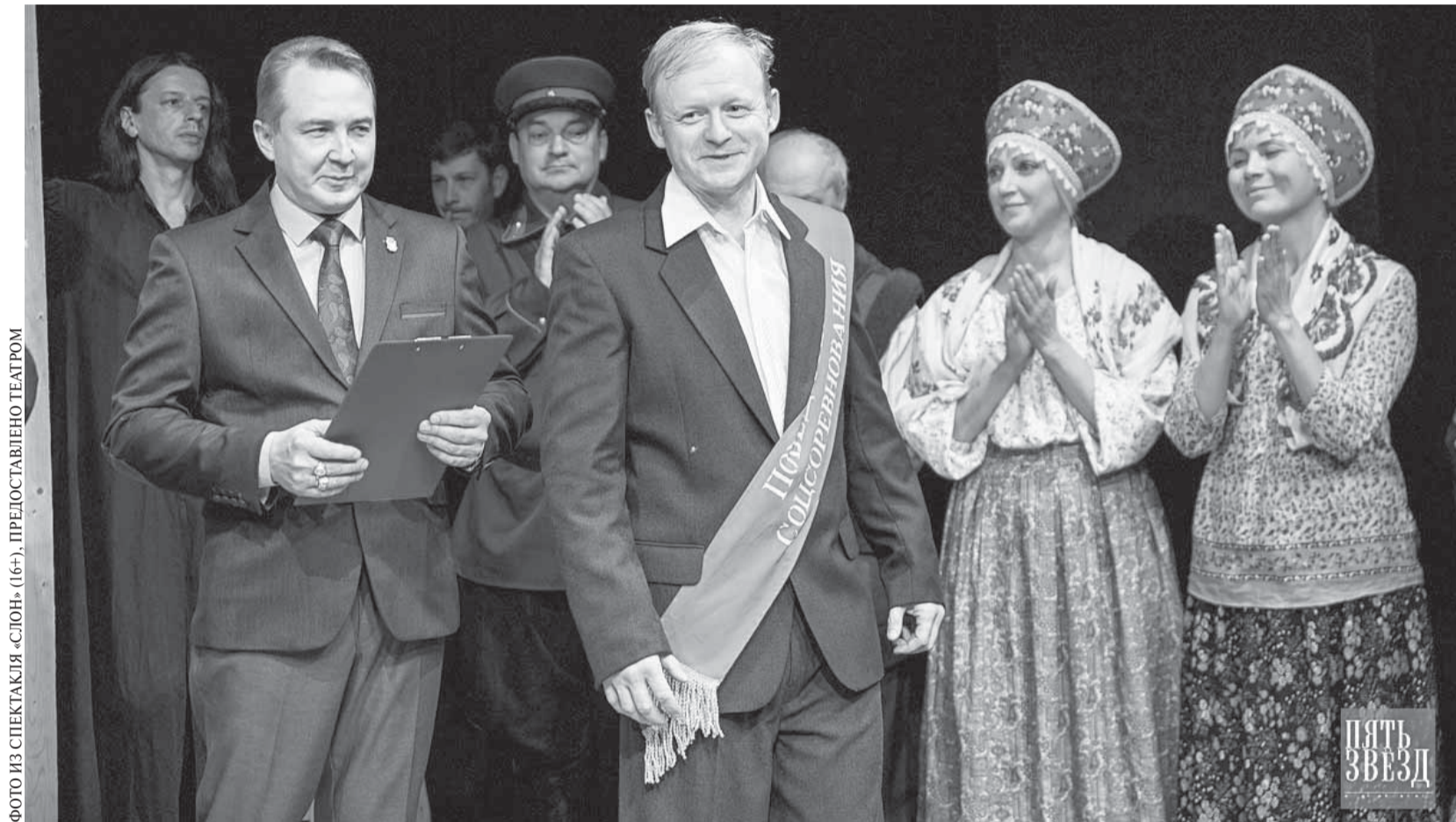
ФОТО ИЗ СПЕКТАКЛЯ «СЛОН» (16+), ПРЕДСТАВЛЕННО ТЕАТРОМ

Юбилейный 30-й сезон Орловского муниципального драматического театра «Русский стиль» им. М.М. Бахтина в разгаре. «Орловская городская газета» продолжает знакомить читателей с людьми, посвятившими себя служению театру.