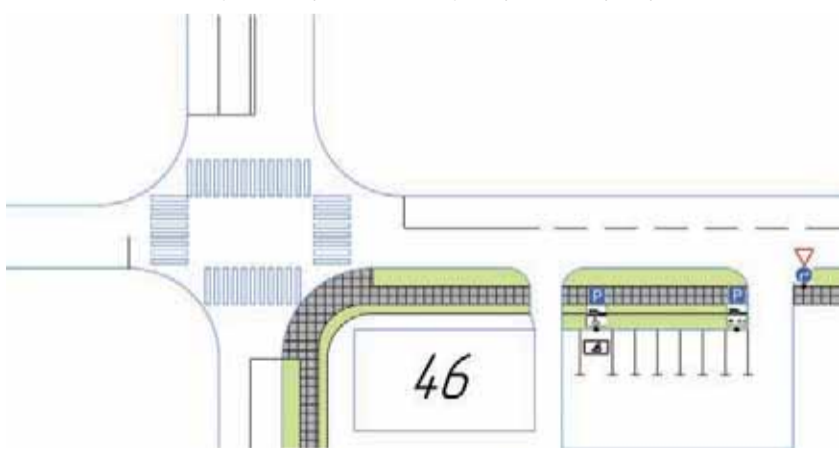
СХЕМА организации открытой гостевой парковки по ул. Веселая в районе дома №46 по ул. Генерала Родина города Орла

Начальник управления строительства дорожного хозяйства и благоустройства администрации города Орла