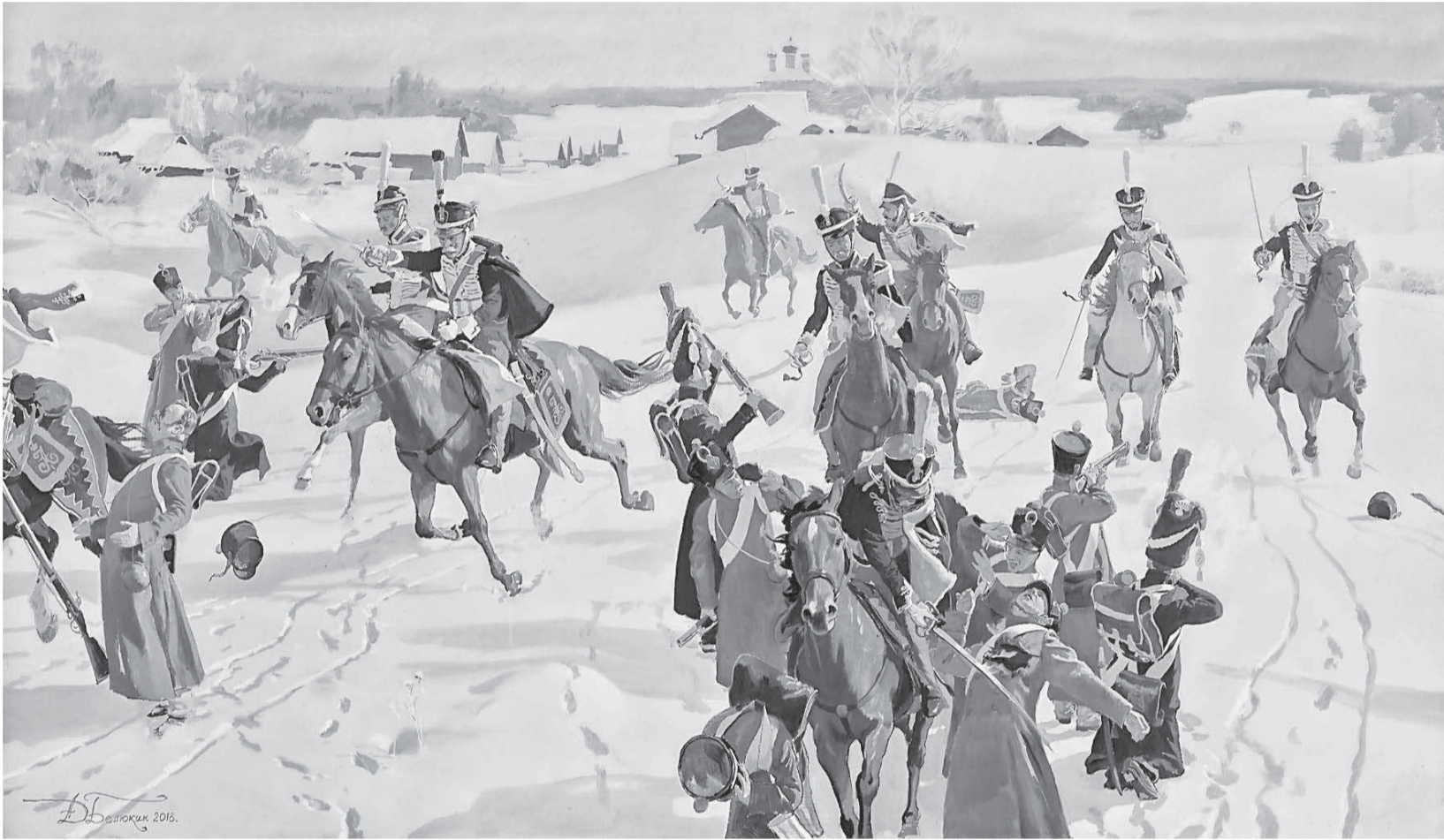
Д.А. БЕЛЮКИН. АТАКА ГРОЗНЕНСКИХ ГУСАР, 2018 Г. СОБСТВЕННОСТЬ МО РФ

В Туристском информационно-выставочном центре Орла можно увидеть персональную выставку народного художника РФ, академика Российской академии художеств Дмитрия Белюкина «Памятник нерукотворный...» К 225-летию со дня рождения А.С. Пушкина» (6+).