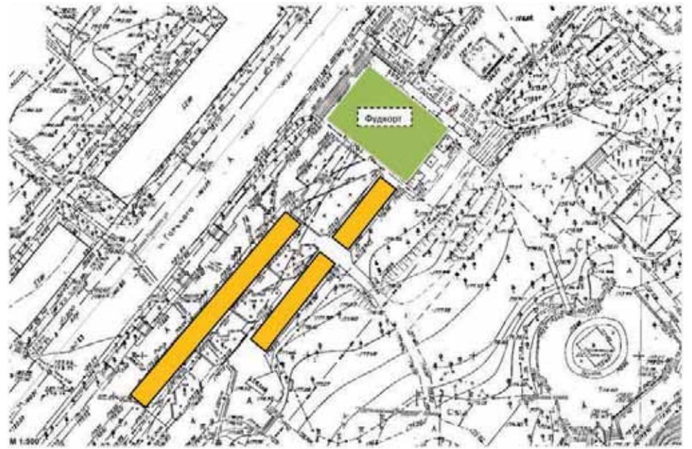
Схема ярмарочной площадки специализированной тематической ярмарки «День мёда» в 2024 году

Приложение № 2 к плану мероприятий по организации специализированной тематической ярмарки «День мёда» в 2024 году