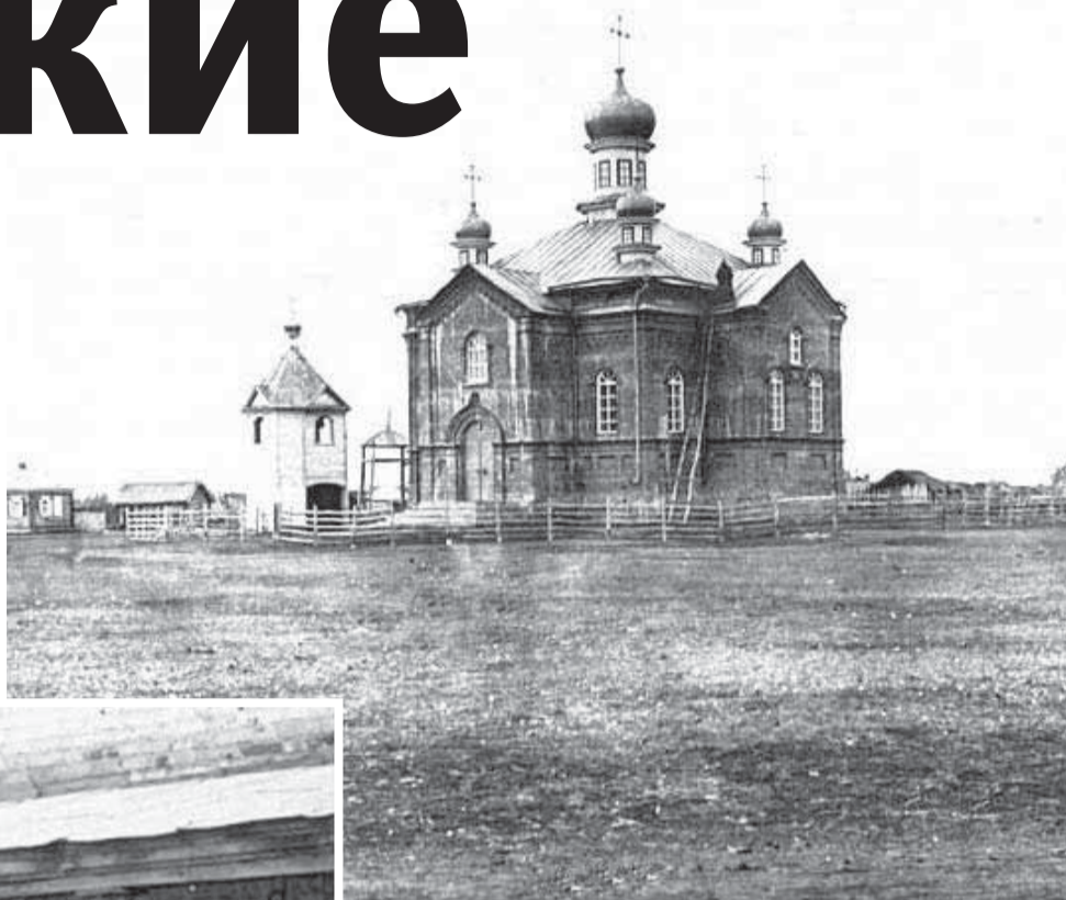
СВЯТО-ЕКАТЕРИНИНСКАЯ ЦЕРКОВЬ С. ШАБЛУКИНО ИШИМСКОГО УЕЗДА ТОБОЛЬСКОЙ ГУБЕРНИИ. 1910-Е ГГ.

В конце XIX – начале XX в. происходила широкая миграция сельского населения Орловской губернии в Сибирь и на Дальний Восток.