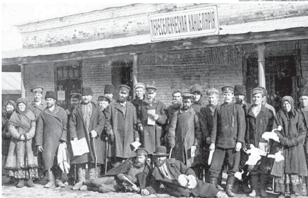
ПЕРЕСЕЛЕНЧЕСКАЯ КАНЦЕЛЯРИЯ В СИБИРИ. 1907 Г.

О дной из причин переселения крестьян, главным образом в восточные регионы Российской империи, являлось малоземелье, другой – осуществляемая государством политика по освоению и заселению необжитых земель в Сибири и на Дальнем Востоке. Значительное количество крестьянских семей покинуло Орловский край в период проведения Столыпинской аграрной реформы, начавшейся в 1906 году.