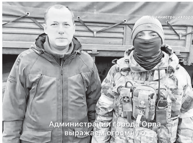
Администрации Города Орла выражаем огромную